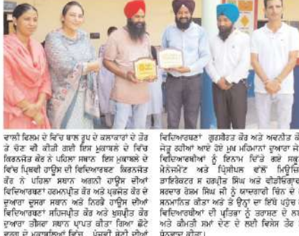
ਪੰਜਾਬੀ ਲੋਕ ਗੀਤਾਂ ਦੀ ਪ੍ਰਤੀਯੋਗਤਾ ਕਰਵਾਈ ਸ਼੍ਰੋਮਣੀ ਗੁਰਦੁਆਰਾ ਪ੍ਰਬੰਧਕ ਕਮੇਟੀ 'ਚ ਪੰਜਾਬੀ ਲੋਕ ਗੀਤਾਂ ਦੀ ਪ੍ਰਤੀਯੋਗਤਾ ਕਰਵਾਈ

ਪੰਜਾਬੀ ਲੋਕ ਗੀਤਾਂ ਦੀ ਪ੍ਰਤੀਯੋਗਤਾ ਕਰਵਾਈ ਸ਼੍ਰੋਮਣੀ ਗੁਰਦੁਆਰਾ ਪ੍ਰਬੰਧਕ ਕਮੇਟੀ 'ਚ ਪੰਜਾਬੀ ਲੋਕ ਗੀਤਾਂ ਦੀ ਪ੍ਰਤੀਯੋਗਤਾ ਕਰਵਾਈ ਸ਼੍ਰੋਮਣੀ ਗੁਰਦੁਆਰਾ ਪ੍ਰਬੰਧਕ ਕਮੇਟੀ 'ਚ ਪੰਜਾਬੀ ਲੋਕ ਗੀਤਾਂ ਦੀ ਪ੍ਰਤੀਯੋਗਤਾ ਕਰਵਾਈ ਸ਼੍ਰੋਮਣੀ ਗੁਰਦੁਆਰਾ ਪ੍ਰਬੰਧਕ ਕਮੇਟੀ 'ਚ ਪੰਜਾਬੀ ਲੋਕ ਗੀਤਾਂ ਦੀ ਪ੍ਰਤੀਯੋਗਤਾ ਕਰਵਾਈ ਪੰਜਾਬੀ ਲੋਕ ਗੀਤਾਂ ਦੀ ਪ੍ਰਤੀਯੋਗਤਾ ਕਰਵਾਈ ਸ਼੍ਰੋਮਣੀ ਗੁਰਦੁਆਰਾ ਪ੍ਰਬੰਧਕ ਕਮੇਟੀ 'ਚ ਪੰਜਾਬੀ ਲੋਕ ਗੀਤਾਂ ਦੀ ਪ੍ਰਤੀਯੋਗਤਾ ਕਰਵਾਈ ਸ਼੍ਰੋਮਣੀ ਗੁਰਦੁਆਰਾ ਪ੍ਰਬੰਧਕ ਕਮੇਟੀ 'ਚ ਪੰਜਾਬੀ ਲੋਕ ਗੀਤਾਂ ਦੀ ਪ੍ਰਤੀਯੋਗਤਾ ਕਰਵਾਈ