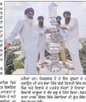
ਗੁਰਦੁਆਰਾ ਸਿੰਘ ਸ਼ਰੀਰਾਂ ਸੋਨਾਣ ਵਿਖੇ ਗੁਰਦੁਆਰਾ ਉਪਰ ਕਲਮ ਰਚਾਉਣ

ਗੁਰਦੁਆਰਾ ਸਿੰਘ ਸ਼ਰੀਰਾਂ ਸੋਨਾਣ ਵਿਖੇ ਗੁਰਦੁਆਰਾ ਉਪਰ ਕਲਮ ਰਚਾਉਣ ਗੁਰਦੁਆਰਾ ਸਿੰਘ ਸ਼ਰੀਰਾਂ ਸੋਨਾਣ ਵਿਖੇ ਗੁਰਦੁਆਰਾ ਉਪਰ ਕਲਮ ਰਚਾਉਣ ਗੁਰਦੁਆਰਾ ਸਿੰਘ ਸ਼ਰੀਰਾਂ ਸੋਨਾਣ ਵਿਖੇ ਗੁਰਦੁਆਰਾ ਉਪਰ ਕਲਮ ਰਚਾਉਣ ਗੁਰਦੁਆਰਾ ਸਿੰਘ ਸ਼ਰੀਰਾਂ ਸੋਨਾਣ ਵਿਖੇ ਗੁਰਦੁਆਰਾ ਉਪਰ ਕਲਮ ਰਚਾਉਣ ਗੁਰਦੁਆਰਾ ਸਿੰਘ ਸ਼ਰੀਰਾਂ ਸੋਨਾਣ ਵਿਖੇ ਗੁਰਦੁਆਰਾ ਉਪਰ ਕਲਮ ਰਚਾਉਣ